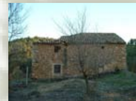
Huerta del Roble

Ruta PR-AB 42 PASEO POR LAS HUERTAS Longitud: 13,2 Km; Cotas Máx: 707 m, Mín: 548 m; Duración recorrido aprox.: 2 horas 57 min 3,2 km de senda y 10 km de camino Sendero circular, Grado de dificultad baja, Diseñado para caminar. Cartografía: PR-AB 42 Mapa topográfico: 1:25.000 - 719 III Época recomendada, otoño, primavera e invierno